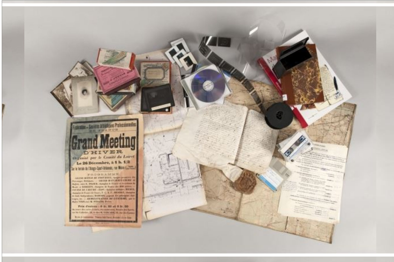
Photographie - sources ; Archives départementales du Loiret