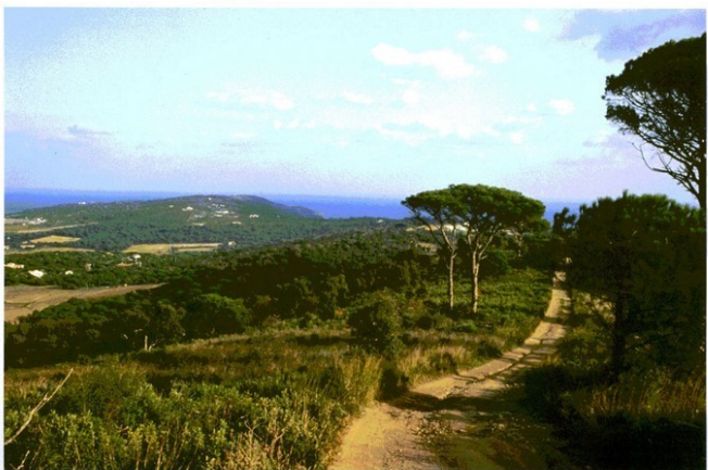
Site des caps méridionaux de la presqu'île de Saint-Tropez et de l'arrière-pays (département du Var) classé par décret du 6 mai 1995