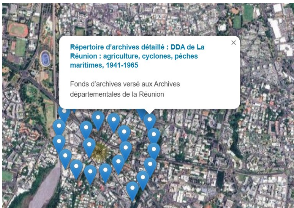
Géolocalisation des fonds d'archives concernant la Réunion

https://ressources.histoire-environnement.org/Carte?filtre=ressources